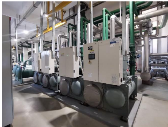
维他奶工厂节能制冷系统

在硬核技术与减排举措的引领，及在能源管理中心协调下，两家工厂将节能减排落实到厂区内每一个运作流程和细节。两家工厂均从消耗和供给两端开展节能规划，设计减碳方向和计划，包括优化运营、设备升级、回收再利用富余能源等举措，以实现全方位生产端的节能减排。举例厂区采用磁悬浮高新节能技术，于传统技术基础上构建了主动式磁悬浮轴承技术及高速永磁同步电机技术，年节电量近 90 万度。与此同时，两家工厂均采用了先进的 PET 干法无菌技术，较传统的杀菌方式节水近 10 倍。在生活区里，两家工厂还充分利用太阳能和空气能，全年节电量达逾 15 万度。不仅于此，凭借能源管理中心提供的强大数据，工厂能精准核算其范围 1 和范围 2 2 的碳排放量，逐年跟踪碳减排进度，进行更精准、更全面的推进碳减排工作。