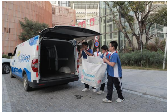
維他奶从 2022 年秋季开始成为深圳「校园奶盒回收行动」长期合作伙伴

除了打造绿色工厂，维他奶在碳减排方面的努力贯彻在整个价值链。从农田开始，维他奶联合农户一起保护农业生态环境，在原材料种植地区实践可持续农业；在生产环节，维他奶使用替代燃料和可再生能源，以逐步迈向生产废弃物零废弃的目标；在消费端，维他奶是中国首批在其纸包产品包装上使用「饮料纸基复合包装回收标识」的企业之一，并在校园和商场开展纸包饮品盒回收教育，以实际行动推动废弃饮品盒的回收利用。