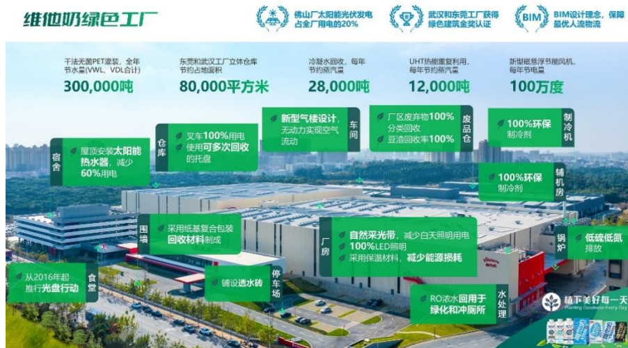
维他奶绿色工厂设计理念

2015年5月，中华人民共和国国务院正式公布《中国制造2025》行动纲领，将「全面推动绿色制造」作为九大战略重点和任务之一。国家级绿色工厂是目前中国最具公信力的荣誉之一，代表生产企业迈向绿色发展及转型的重要认可。维他奶(东莞)有限公司(下称「东莞工厂」)以及维他奶(武汉)有限公司(下称「武汉工厂」)荣获「国家级绿色工厂」称号，足证我们在能效水平、洁净能源利用、废弃物综合利用等指标方面均达到或优于国家相应的标准。